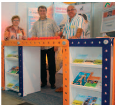
Stand von Jugendweihe Deutschland und Messegelände