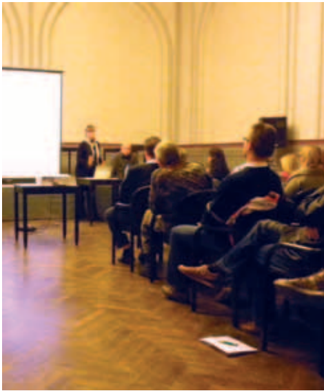
Einblick in die Veranstaltungen