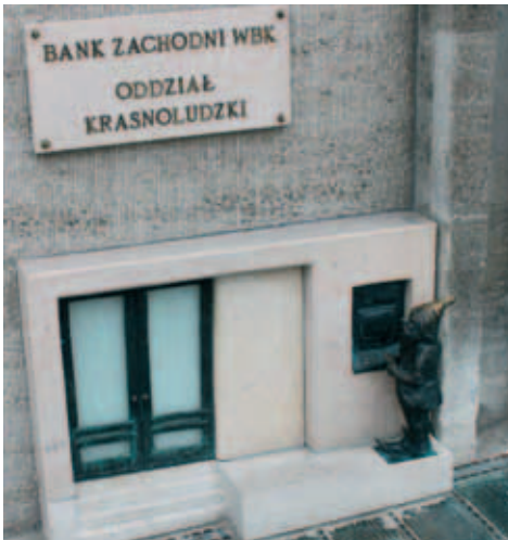
Bild 1 Die Breslauer Zwerge