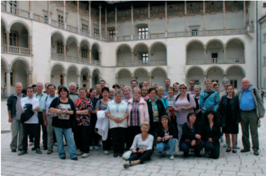
Teilnehmer der Weiterbildungsfahrt auf dem Wawel in Kraków

Wechsel und das feurige Treiben des aus der Sage her bekannten Drachens. Danach nahm uns der abendliche Zauber des Marktplatzes gefangen. Zum Abschluss dieses anstrengenden Tages ließen wir uns in einem historischen Restaurant in der Altstadt nieder. Das Nationalitäten-Essen hat den meisten von uns sehr gut geschmeckt. Etwas beengt aber sehr gemütlich haben wir noch bei einem guten Wein zusammen gegessen und geplaudert.