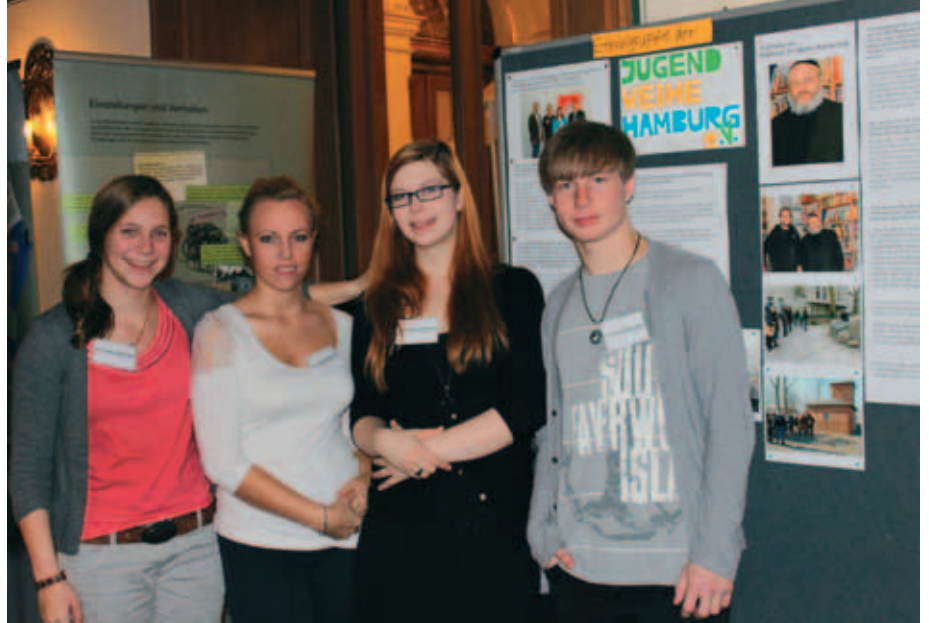
Teilnehmer der Jugendweihe Hamburg

„Gestern ist vorbei, aber Fremdenfeindlichkeit, Terrorismus, Intoleranz und Gewalt gefährden heute unsere freie Gesellschaft. Mischt euch ein! Zur Nacht der Jugend kommt, wer nicht schweigen will! Ihr seid gefragt – auf den Bühnen, bei Aktionen und als Zuhörer“ (Auszug aus dem Veranstaltungsflyer).