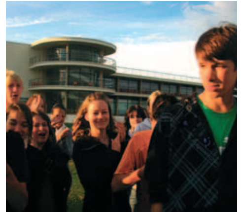
Sprachreise Bexhill-on-Sea, England